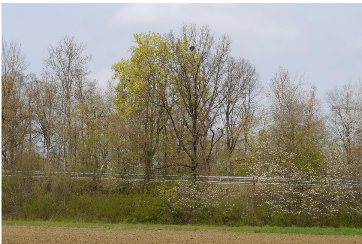
Abb. 12: Baumhecke an der Böschung der Staatsstraße St2231. Auf einem der Bäume ist ein "Krähennest" erkennbar.

Der Nordrand des Geltungsbereiches, angrenzend an Ackerfläche Flur 2104/1, ist die ansteigende Böschung der Staatsstraße 2231. Auf der Böschung stockt eine gut strukturierte Baumhecke aus mittelalten bis alten Laubbäumen und dichtwüchsigen Gebüsch im Unterwuchs (Abb. 12). Auf zwei Altbäumen sind große Nester, die mutmaßlich von Krähen, Elstern oder Ringeltauben ehemals bebrütet wurden. Die Hecke kann von störungstoleranten Vogelarten (Baumbrüter und Heckenbrüter) als Bruthabitat genutzt werden. Da aufgrund der Lage und der starken verkehrsbedingten Störeinflüsse seltene und anspruchsvolle Arten mit großer Wahrscheinlichkeit nicht vorkommen können, besitzt dieser Gehölzkomplex nur eine mittlere naturschutzfachliche und eine geringe artenschutzrechtliche Bedeutung.