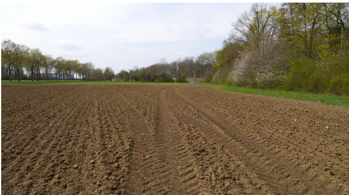
Abb. 4: Ackerfläche im Ostteil des Geltungsbereiches (Flur 2104/1). Rechts: Böschung zur St2231.

Die Flurstücke 1062 und 2104/1 sind Äcker und stellen gemeinsam mit der o.g. Wiese (Flur 2104/11) den hauptsächlichen Baubereich der Gewerbegebietserweiterung dar (Abb. 4, 5).