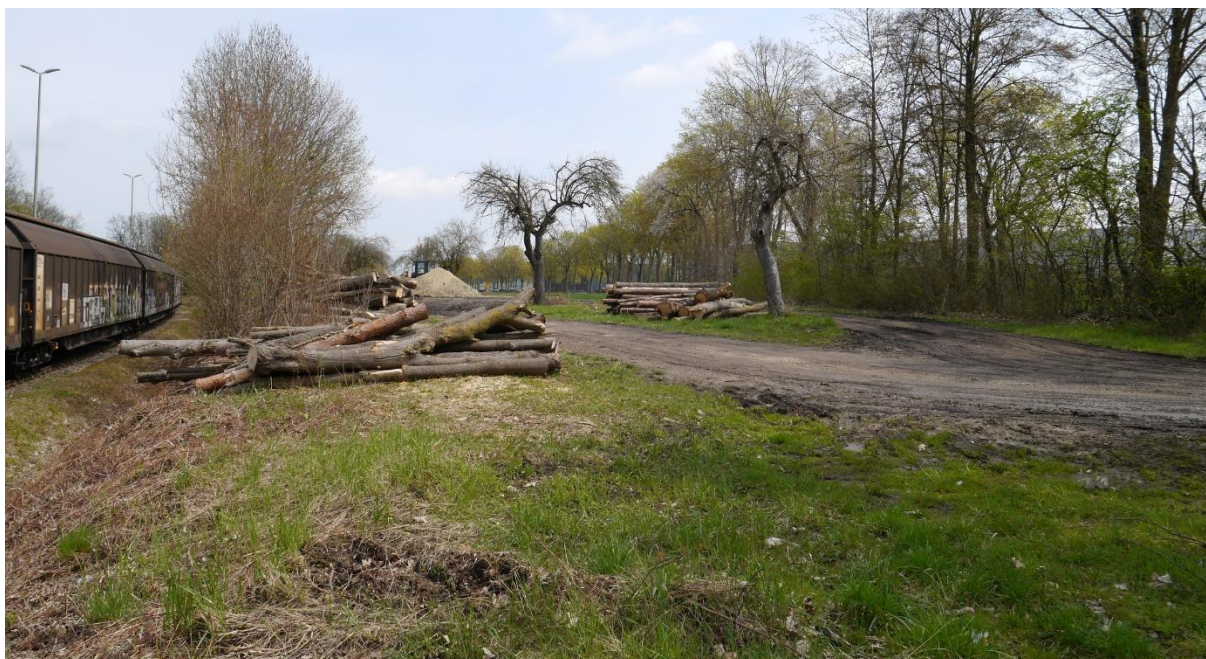
Abb. 9: Lagerfläche im Westteil des Geltungsbereiches mit zwei alten Obstbäumen.

Zwischen Ackerfläche 1062 und der Bahnlinie am Nordwestrand des Geltungsbereiches bilden die zwei langgezogenen Flurstücke 2100/3 und 2105/2 einen zusammenhängenden extensiven Wiesenstreifen mit alten Obstbäumen (Abb. 10, 11). Lediglich im Westen ist ein Teil der Fläche als Lagerplatz freigeräumt (Abb. 5). Dort stehen noch zwei weitere alte Obstbäume (Abb. 9).