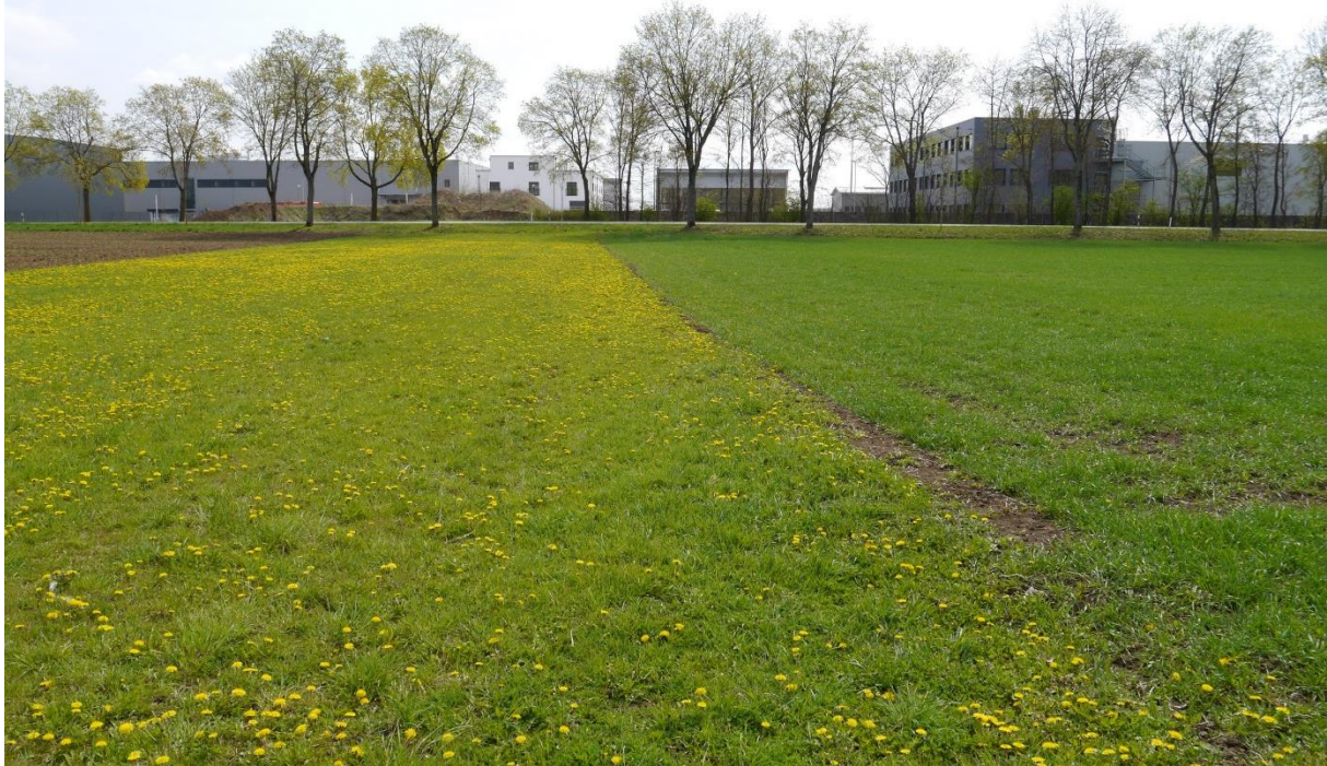
Abb. 3: Wiesenparzelle im Geltungsbereich (Flur 2104/11). Im Hintergrund Baumallee entlang der EI39.

Daher kann eine artenschutzrechtliche Bedeutung der im Geltungsbereich vorliegenden Wiesenstrukturen weitgehend ausgeschlossen werden. Die extensiven Grasfluren dienen aber als Nahrungsraum für im Umfeld brütende Vogelarten und besitzen daher zumindest einen mittleren naturschutzfachlichen Wert.