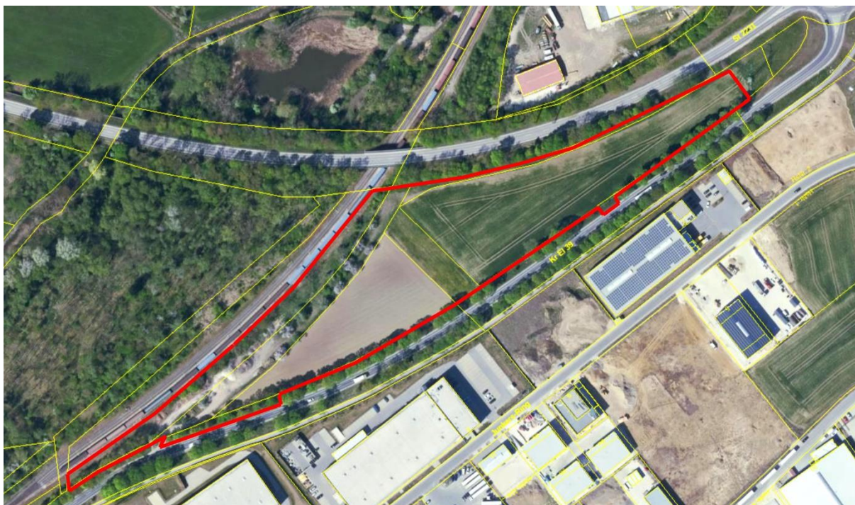
Abb. 1: Geltungsbereich des Vorhabens (rote Abgrenzung).

Der zur Überbauung geplante Bereich sind zwei Äcker und eine Grünlandfläche. Diese grenzen an Strukturen an, die teilweise noch innerhalb des Planungsraumes liegen (Westrand) oder durch das Vorhaben als Wirkraum tangiert werden. Bei diesen Strukturen handelt es sich um Gehölzbestände, die als Baumallee, als Baumhecke und als Streuobstbestand den Geltungsbereich säumen.