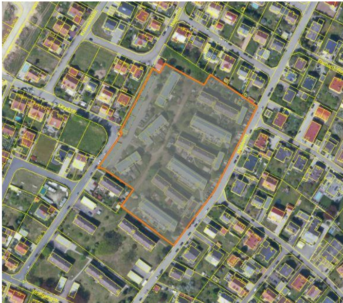
Abb. 1: Luftbild mit Flurkarte 1 , mit Kennzeichnung des Plangebiets