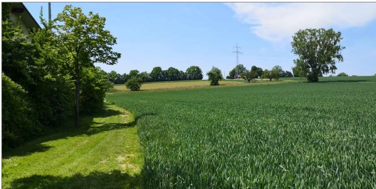
Abb.4: Blick von Osten auf das Vorhabensgebiet (Jungwirth).