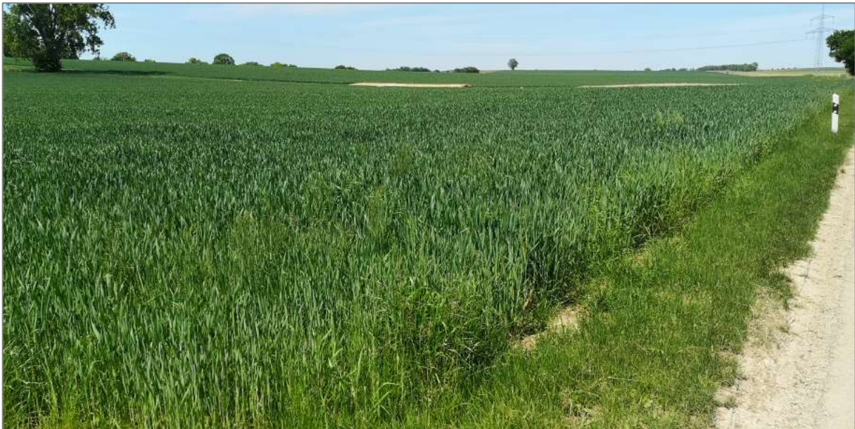
Abb.3: Lage des Vorhabens mit Blickrichtung nach Norden (Jungwirth).

Im Bereich der Ackerrandstreifen konnte kein Nachweis für das Vorkommen der Zauneidechse oder anderer, planungsrelevanter Arten erbracht werden.