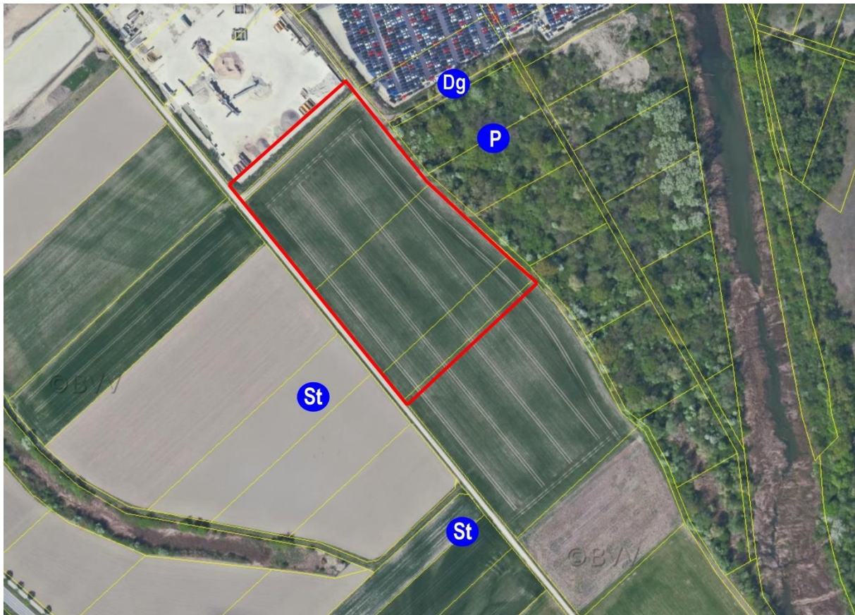
Abb. 10: Brutplätze bzw. Revierzentren (blaue Punkte) von artenschutzrechtlich relevanten Vogelarten im Untersuchungsgebiet. Dg = Dorngrasmücke; P = Pirol; St = Schafstelze. Rote Linie: Abgrenzung des Geltungsbereiches.

Obwohl die Dorngrasmücke und der Pirol als grundsätzlich relevante Vogelarten im Umfeld nachgewiesen und in Abbildung 10 dargestellt wurden, sind weder gebüschbrütende noch baumbrütende Singvogelarten, noch Spechte von dem Vorhaben direkt betroffen oder indirekt beeinträchtigt (keine Störung innerhalb des Wirkraumes). Ihre Belange werden daher nachfolgend nicht weiter diskutiert.