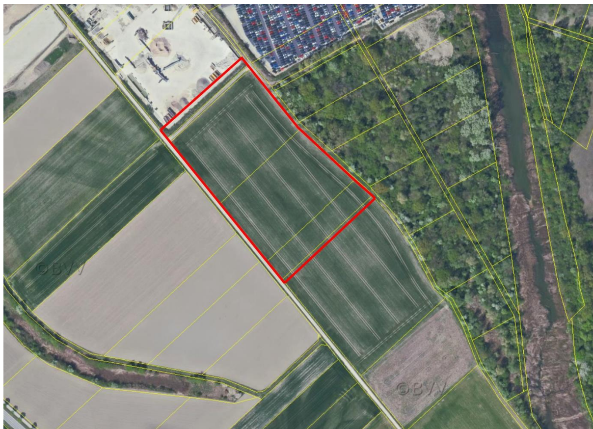
Abb. 1: Geltungsbereich des Vorhabens (rote Abgrenzung).

Der Geltungsbereich besteht fast vollständig aus Ackerfläche (Fluren 6129, 6130, 6131, 6132). Lediglich im nordwestlichen Anschluss an das bestehende Industriegebiet finden sich als weitere Strukturen ein geschotterter Feldweg und ein Abgrenzungswall aus Sand-/Erd-Substrat mit ruderalem Bewuchs. Das Umfeld besteht aus weiteren Agrarflächen (Äcker, Ackerbrache) im südöstlichen und westlichen Anschluss. Am Westrand trennt ein geteeter Flurweg den Geltungsbereich von weiteren Äckern. Im Norden schließt das vorhandene Industriegelände "Ochsenschütt" an. Östlich grenzt der Auwald der Donau mit strukturreichem, teilweise altem Laubbaum-Bestand und zahlreichen Altwassern an. Ein Waldstreifen von etwa 70 m Breite trennt den Ostrand des Geltungsbereiches von der Westgrenze des FFH-Gebietes 7136-304.06 "Donauauen zwischen Ingolstadt und Weltenburg".