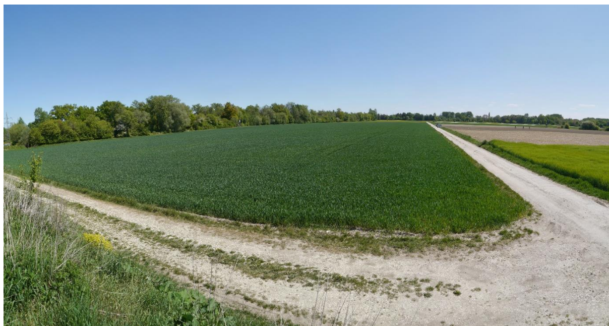
Abb. 2: Panorama-Blick auf den Geltungsbereich vom Nordwestrand (Erdwall oberhalb des Feldweges) aus. Aufnahme datum: 06.05.2020.