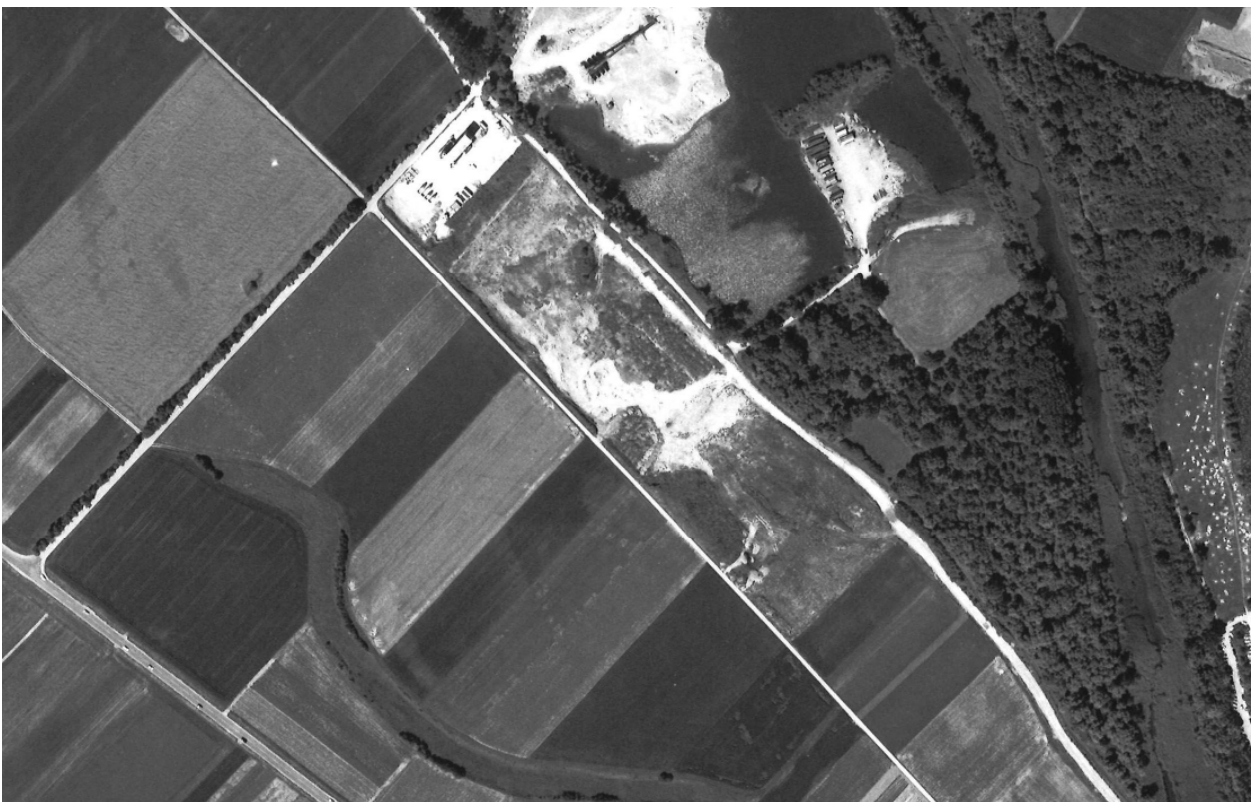
Abbildung: Bildflug 07.07.1991 (Bildflug Nr. 91105/0, Streifen 2, Bild 129 – Wiederverfüllung im Abschluss

Allgemein gilt: im Bereich der wiederverfüllten Nassabbauflächen ist der Aushub für Baumaßnahmen auf Altlastenverdacht hin zu prüfen. Eventuell festgestellte Verunreinigungen müssen