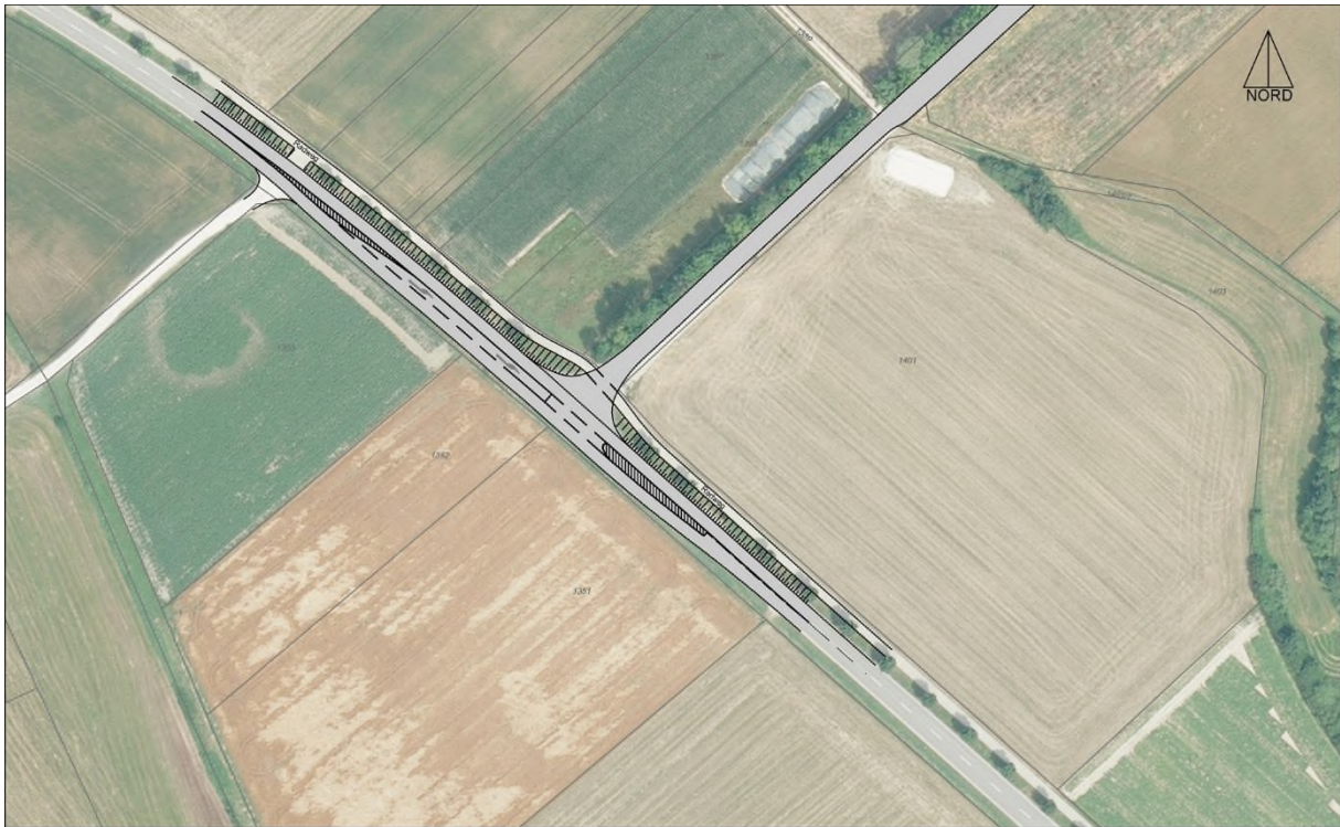
Abbildung: Skizzierung Linksabbieger PAF 34 – außerhalb des Geltungsbereiches

der Ochsenschüttstraße an die Kreisstraße PAF 34 befindet, wurde die PAF 34 dazu mit einer Linksabbiegespur versehen.