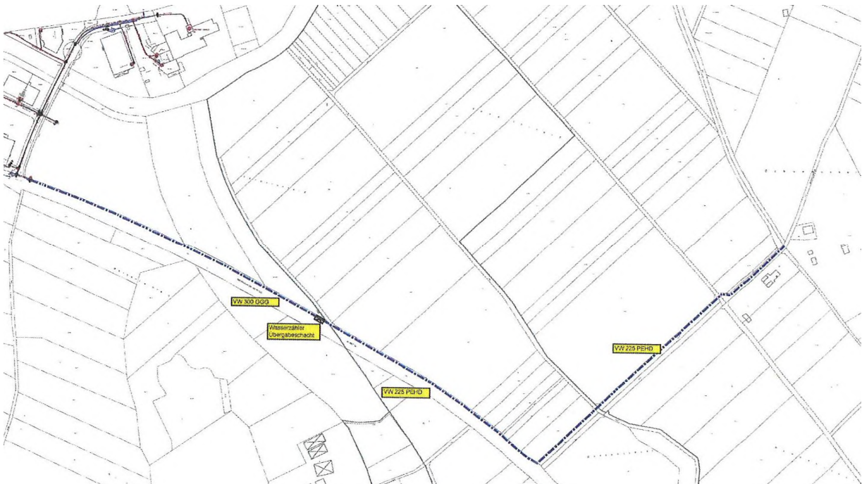
Abbildung: Verlauf der Trinkwasserleitung4 – außerhalb des Geltungsbereiches

Die Abwasserentsorgung erfolgt über den seit 1998 bestehenden, im Feldweg Flurnummer 6155 liegenden, Mischwasserdruckkanal mit Pumpstation. In einer Untersuchung im Auftrag der Gemeinde Großmehring von 2008 3 wurde die ausreichende Leitungsfähigkeit des Kanals auch für die vorgesehene sowie künftig noch mögliche Erweiterung (ca. 13 ha) der Gewerbeflächen nachgewiesen.