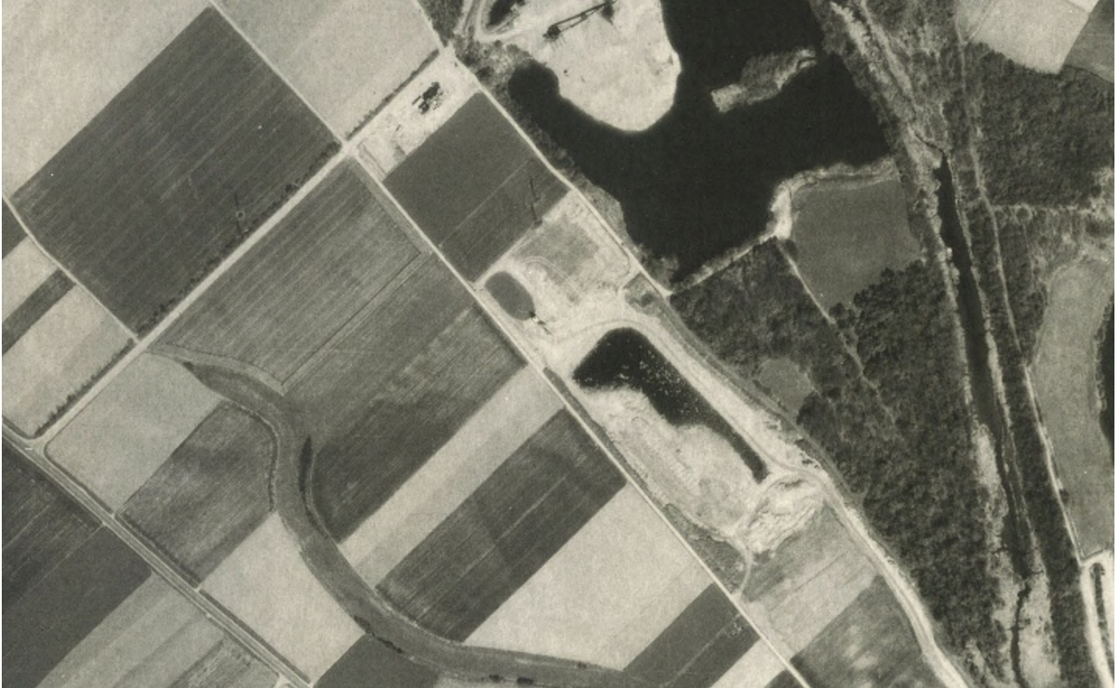
Abbildung: Bildflug April 1987 (Freigegeben durch Regierung von Oberbayern Nr. G 68/2) – Restwasserfläche noch erkennbar